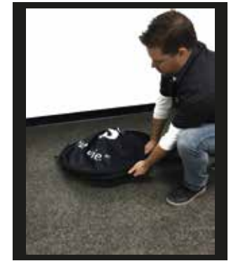
Et voilà, il ne vous manque que le sac pour bien de ranger !