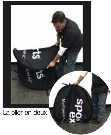
La plier en deux