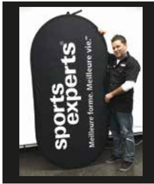
Tenir la bannière à la verticale